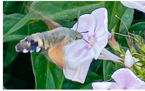
Taubenschwänzchen Moro-sphinx Hummingbird hawk-moth Macroglossum stellatarum