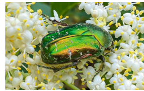
Rosenkäfer Cétoine dorée Green rose chafer Cetonia aurata