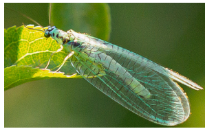
Gemeine Florfliege Chrysope verte Common green lacewings Chrysoperla carnea