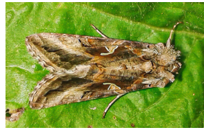
Gammaeule Gamma Silver Y Autographa gamma