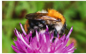
Ackerhummel Bourdon des champs Common carder bee Bombus pascuorum