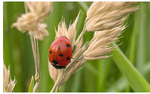
Siebenpunkt-Marienkäfer Coccinelle à sept points Seven-spot ladybird Coccinella septempunctata