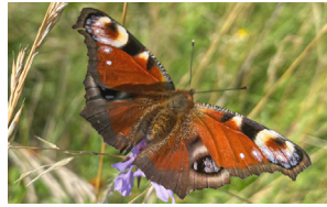
Tagpfauenauge Paon-du-jour Peacock butterfly Aglais io