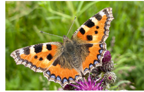
Kleiner Fuchs Petite tortue Small tortoiseshell Aglais urticae