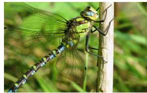
Blaugrüne Mosaikjungfer Aeschne bleue Blue hawker Aeshna cyanea