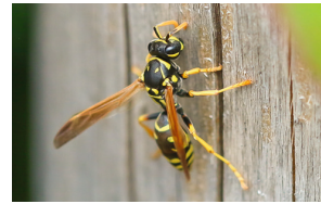
Haus-Feldwespe Poliste commun European paper wasp Polistes dominula