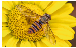
Hainschwebfliege Syrphe ceinturé Marmalade hoverfly Episyrphus balteatus